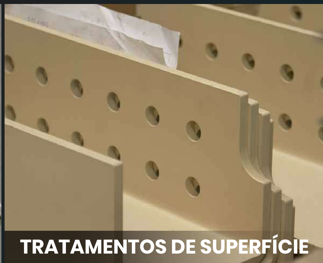
TRATAMENTOS DE SUPERFÍCIE